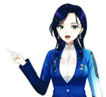
チャットボット・キャラクター「ミスミアイ」

知も拡大できるだろう。また、同事業の一環として地方在住のエンジニアを、リモートワークを前提に現地在住のまま採用するという構想もある。その際の給与基準は東京に合わせるため、首都圏と地方の賃金格差の解消にも一役買うだろう。社名の由来にもなった「三方よし」の精神のごとく、事業に関わる全員が幸福になることを目指し、それを理想で終わらせずにきちんと実践するのが同社の大きな特徴。「ICTの悩みであればどんなことでもご相談ください」と自信をのぞかせるトライビュー・イノベーションの存在感は、これからもどんどん増していくだろう。