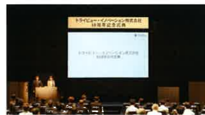
10周年を機に企業ロゴを一新(上)。7月7日に開催された10周年記念式典の様相(下)。