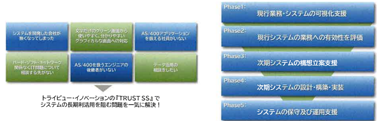
トライビュー・イノベーションの『TRUST SS』でシステムの長期利活用を阻む問題を一気に解決！